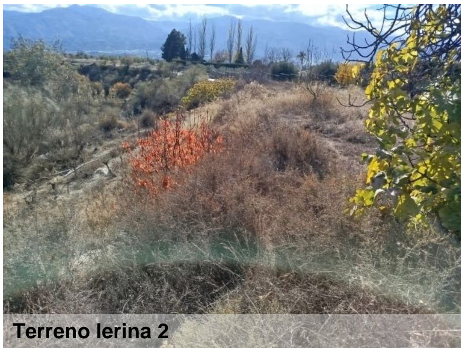
Terreno lerina 2