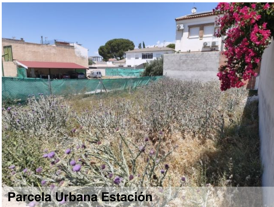
Parcela Urbana Estación