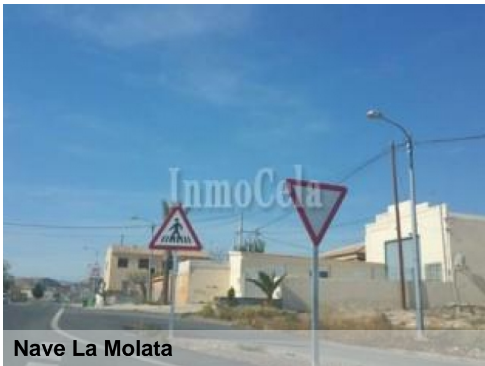
Nave La Molata