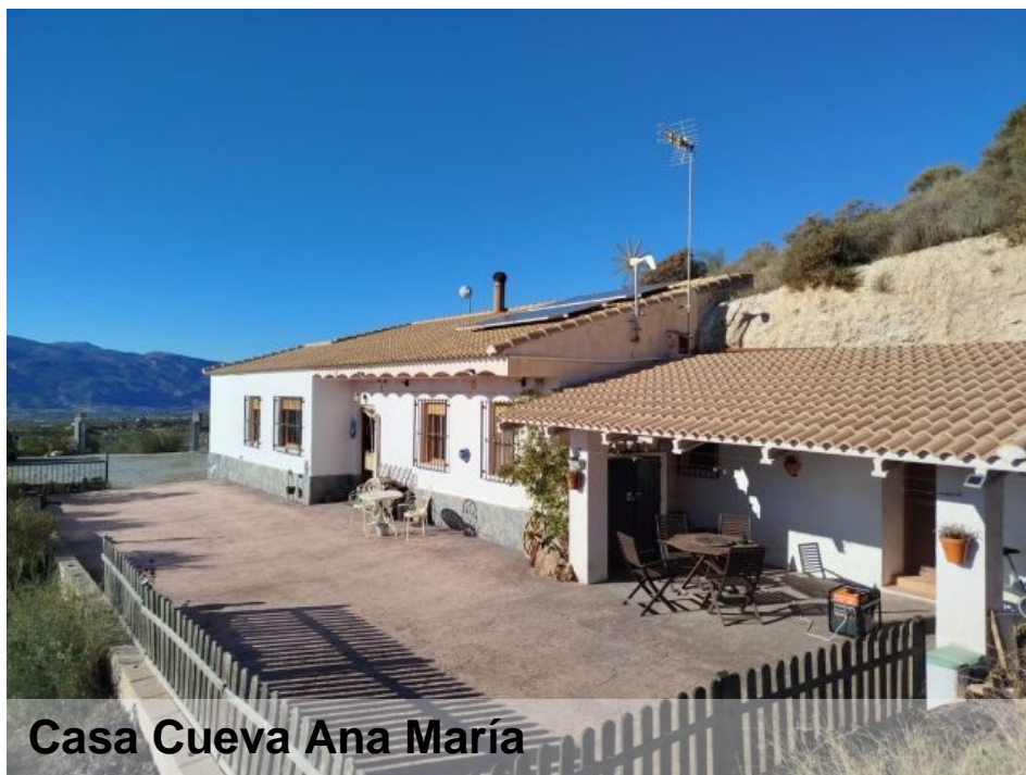
Casa Cueva Ana María