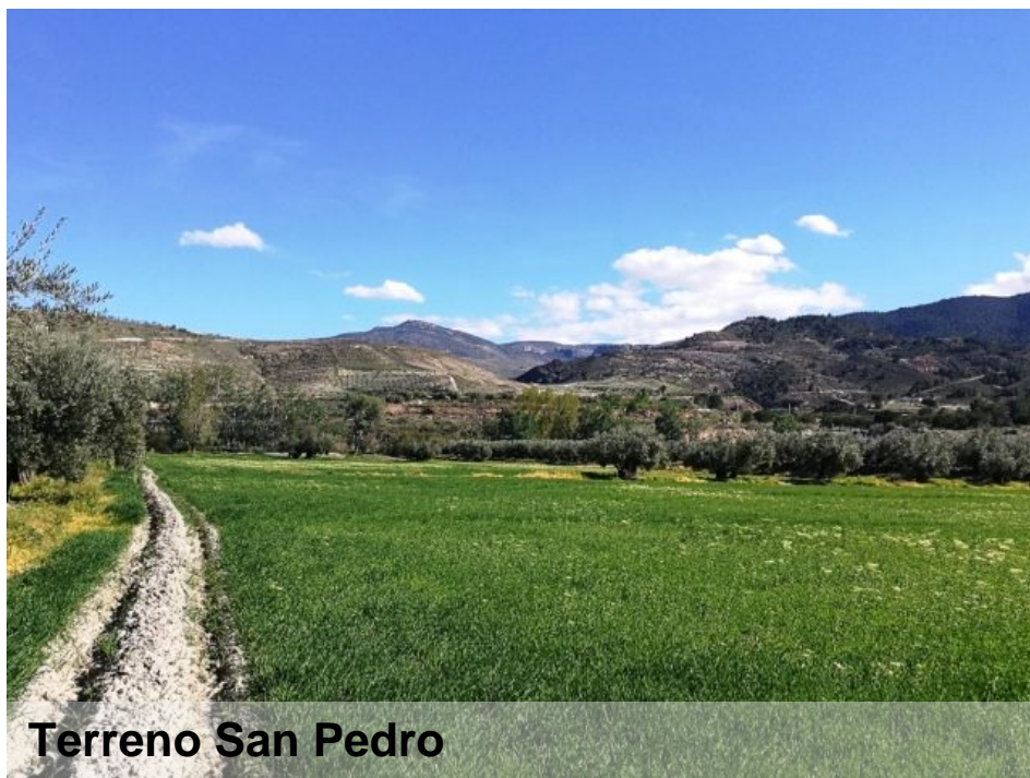
Terreno San Pedro