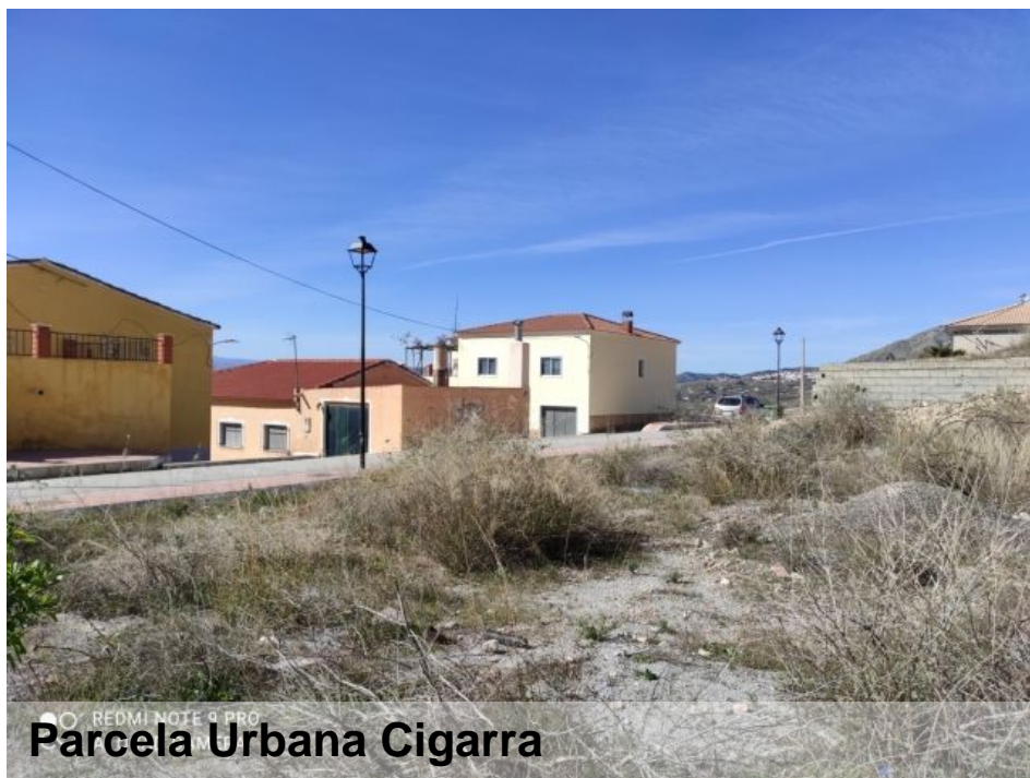
Parcela Urbana Cigarra