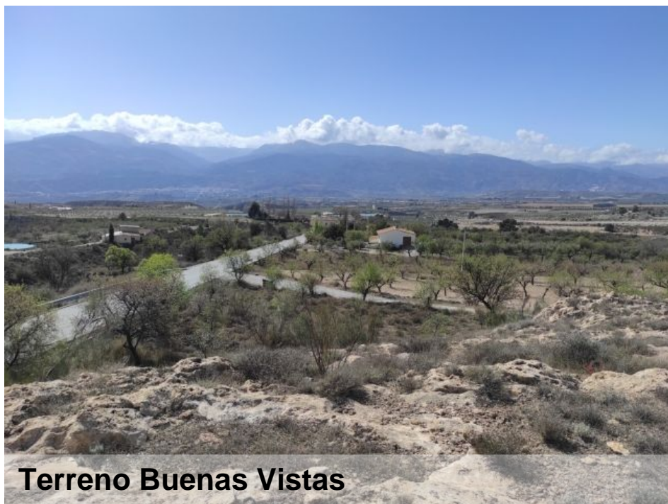
Terreno Buenas Vistas