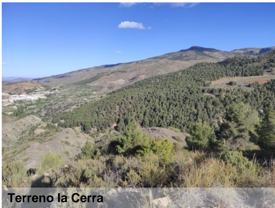
Terreno la Cerra