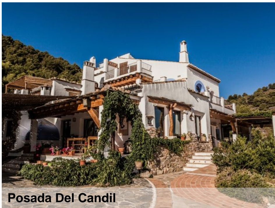
Posada Del Candil