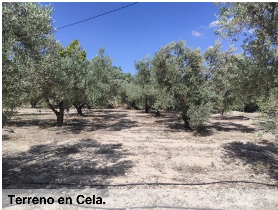
Terreno en Cela.